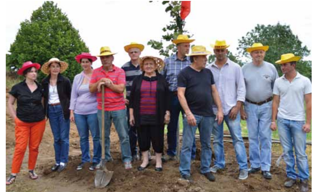
Le nouveau conseil municipal au complet

Rendez vous est d'ores et déjà pris pour le premier samedi de juillet 2015 afin de pérenniser ce type de rencontre estivale !