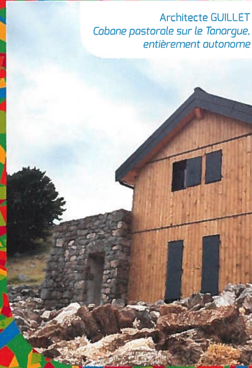
Architecte GUILLET Cabane pastorale sur le Tanargue, entièrement autonome

jeudi 01 Annonay mercredi (après-midi) 07 Les Vans mercredi 14 Privas jeudi (matin) 15 Jaujac jeudi (après-midi) 15 Vallon-Pont-d'Arc mercredi (après-midi) 21 Le Teil mercredi (matin) 28 Lamastre mercredi (après-midi) 28 Saint-Péray jeudi 29 Aubenas